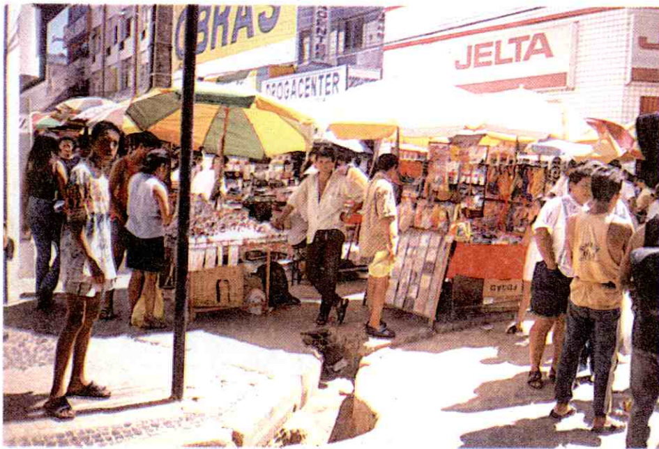
Ruas totalmente ocupadas impedem a passagem de pedestres no centro