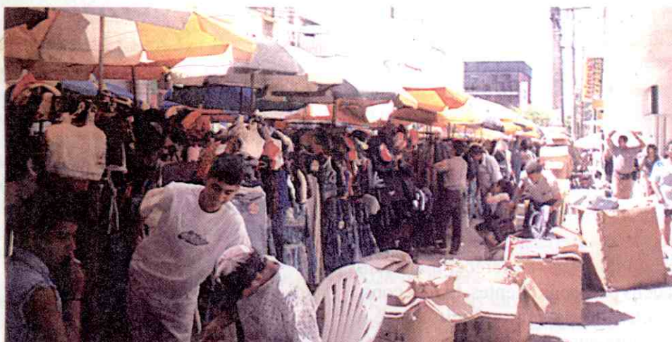
Centro precisa de reforma urgente.

Leia ainda: SPC oferece segurança para vendas com cheque